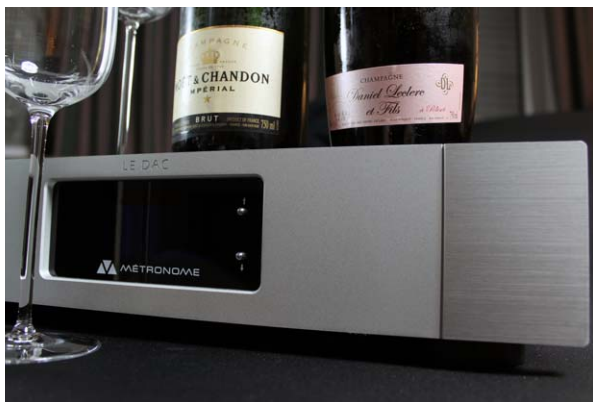
Gutes aus der französischen Feinkostabteilung ...

nen. Und beim südkoreanischen SOtM erinnere ich mich an eine gewisse Bocksteifigkeit untenrum, die ihn daran hinderte, etwa Paul Chambers legendären Bass auf Kind of Blue richtig swingen zu lassen.