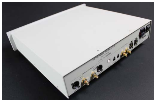
Alles da, was der Klangpurist braucht: der Métronome Le Dac bietet eingangsseitig S/PDIF (Cinch, AES/EBU, Toslink) sowie USB-B. Analog hinaus geht es per Cinch oder XLR

Unser Testgerät Métronome Le Dac entstammt deren Classic-Serie und markiert damit eigentlich den Einstieg in die Klangwelten der Gallier. Doch schon die selbstbewusste Namensgebung weist recht unverblümt darauf hin, dass unser Proband mit klassischem „Einstiegs-Hifi“ gleichwohl nichts am Hut hat. Sein Preis von 6.100 Euro positioniert Métronomes Le Dac klar im High-End-Bereich.