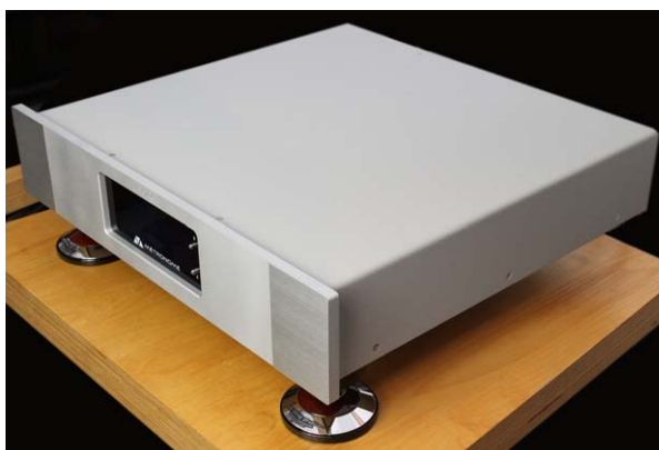
Der Métronome Le Dac mit Untersetzern von Harmonix (aus der Zubehörkiste des Autoren, nicht im Lieferumfang)

Der Métronome Le Dac verfügt über ein solides und penibel verarbeitetes Stahlblechgehäuse mit massiver Aluminiumfront. Zur Wahl stehen Alu-natur und Schwarz. Mit 425 x 130 x 415 Millimetern stemmt sich der Franzose gegen trendige Mid- oder Small-Size-Formate und belegt ein vollständiges Board auf meinem Copulare-Rack.