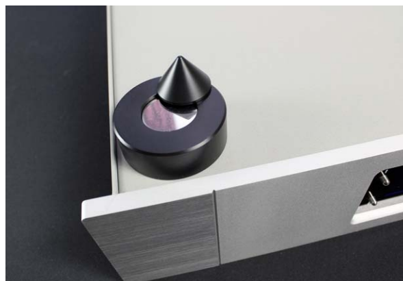
Die magnetisch haftenden Spikes aus Delrin (POM – Polyoxymethylen) bringen noch etwas mehr Feinzeichnung

Nimmt man den Stahlblechdeckel ab, fällt zunächst die von vier Ringkern-Trafos verantwortete Stromversorgung auf. Drei davon kümmern sich ausschließlich um D/A-Wandlung und Audioschaltkreise,