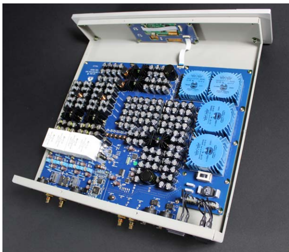
Eine wahre Kapazität: 144000 Mikrofarad ergeben die unzähligen keinen Elkos des Métronome Le Dac

Die eigentliche D/A-Wandlung erledigt im Métro- nome Le Dac ein „Asahi Kasei Microsystems AK 4493“-DAC-Chip in Stereoausführung. Es ist kein Geheimnis, dass der seit 2018 erhältliche 32-Bitler auch in deutlich preiswerteren DACs zu finden ist. Doch die Gesamtperformance eines Wandlers wird eben ganz entscheidend von der Schaltungsumgebung, in der ein Chip seine Arbeit verrichtet, geprägt. Interessant ist die DAC-Bestückung des Le Dac auch deshalb, weil dem AK4493 gelegentlich nachgesagt wird, klanglich die Signatur sogenannter Ladder-DACs nachzuahmen. Einen solchen Ladder-DAC, nämlich den Wavelight von Rockna, nutze ich seit einiger Zeit selbst.